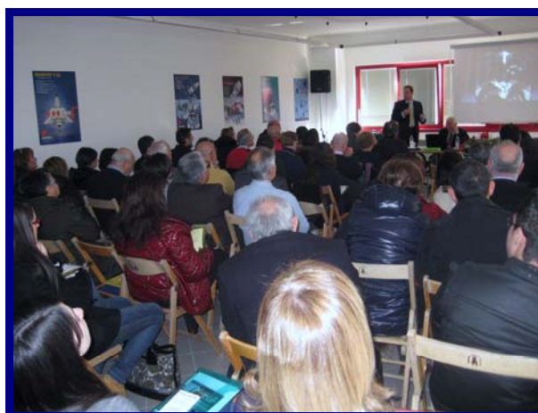
I partecipanti in aula durante i lavori