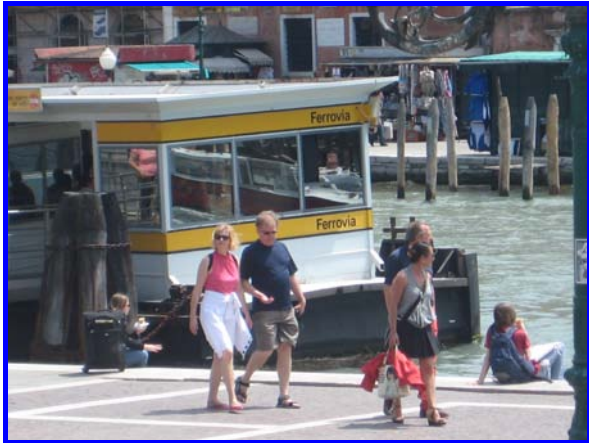
Ferrovia ?? .... e i binari??