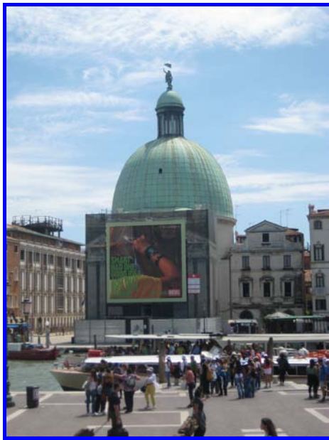
L'arrivo alla stazione di Venezia

discutere se l'introduzione della posta elettronica possa integrare una riunione annuale di sezione. Per quanto riguarda le deleghe, l'opposizione più significativa è quella di non ridurre un'assemblea annuale ad una riunione di condominio. Resta fermo il fatto che il Congresso Nazionale è l'unico appuntamento annuale condiviso dalla maggior parte dei soci e pertanto è il momento migliore per raccogliere energie, proposte e consultazioni all'interno dell'Assemblea di sezione. La correttezza vuole che chi non può partecipare, invii al coordinatore la giustificazione (ai fini della validità dell'Assemblea). D'altro canto il regolamento delle sezioni, facilmente consultabile da tutti sul sito SIMFER, non prevede altro che la discussione e l'approvazione delle decisioni prese all'interno dell'assemblea stessa, le quali devono essere riassunte nei verbali da trasmettere all'UDP. Per venire incontro alle esigenze dei soci, si avvanzeranno proposte per diversi modi di iscrizione e partecipazione ai congressi nazionali. Chi avesse consigli a tal riguardo è pregato di comunicarmeli ( gentilisandro@libero.it ) cosicché io possa rappresentarli in sede di riunione dei coordinatori.