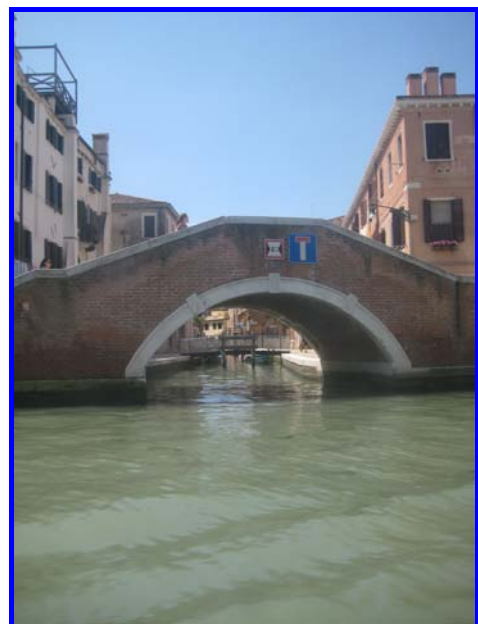
ma attenti alla testa, ponte pericoloso!