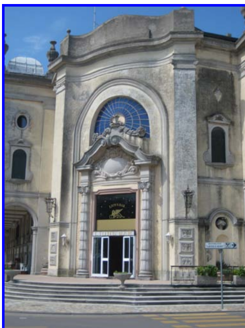
L'area antistante la sede congressuale