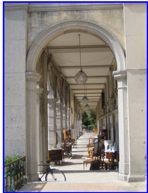
Il Viale delle Botteghe (vicino la sede congressuale)