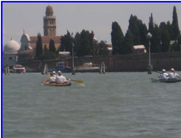
.....e la sera tutti in palestra