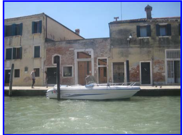
Quando si dice..... posto "auto"