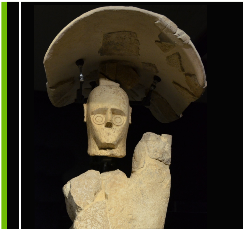
I Giganti di Mont'e Prama (Sos Ziganates de Mont'e Prama)

6 -27 Maggio 2017 Caesar's Hotel Cagliari